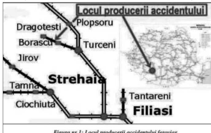
Figura nr.1: Locul producerii accidentului feroviar

efectuate la suprastructura căii după producerea accidentului, prezentate în cuprinsul raportului de investigare al AGIFER, s-a ajuns la concluzia că deraierea trenului încărcat cu cărbune s-a produs din următorii factori: „Starea necorespunzătoare