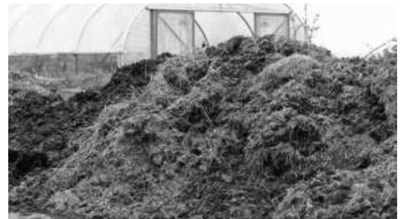
tine din toată compoziția sa.

În general se apreciază că doza optimă anuală este de 10 to de gunoi mixt de grajd pe hectar , dar la noi ideal este să se administreze deodată 40 - 100 to / ha , funcție de cultura căreia i se administrează, și să se revină după atâția ani câte zeci de tone au fost administrate . Gunoiul de pasăre se administrează în cantități pe jumătate sau chiar o treime din cele de gunoi mixt, căci are compoziție mult mai bogată în elemente nutritive, și să nu depășească 25 - 30 to/ha la o administrare. În general, la o administrare de 40 to gunoi de grajd mixt/ha , în primul an acesta cedează solului jumătate din substanțele conținute, în al doilea an jumătate din ce a rămas - adică un sfert din total, iar în anii 3 și 4 câte o op-