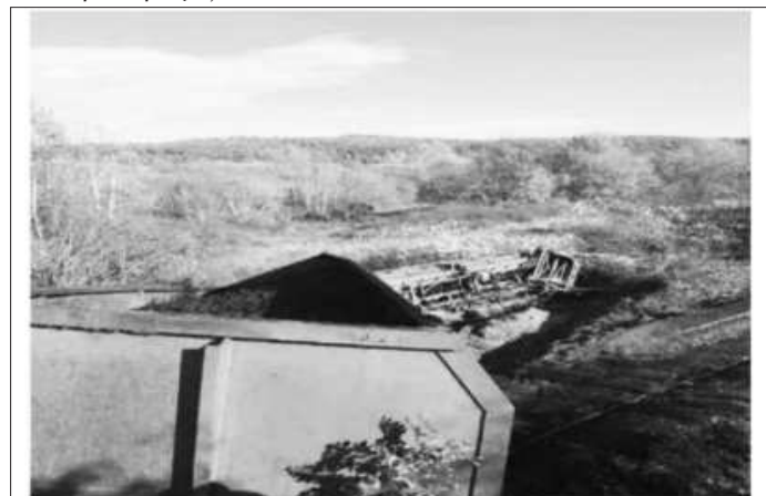
Foto nr.1: Primul vagon răsturnat la 12 m distanță de șină și al 2-lea vagon deraiat

La data producerii accidentului feroviar din Gorj, mentenanța liniilor și aparatelor de cale de pe raza de activitate a acestui district era asigurată de un șef de district linie, un piccher, cinci revizori de cale, doi meseriași de întreținere cale și doi muncitori necalificați. „Comisia de investigare a reținut că la funcția meseriași întreținere cale există un deficit de 52 de lucrători din totalul necesar de 56 de lucrători. Se poate concluziona astfel că lipsa corelării necesarului de personal cu necesarul de lucrări rezultate în urma recensămintelor efectuate la districtul de linie are implicații directe în activitatea de mentenanță, favorizând manifestarea pericolului de deraiere a trenurilor”, se concluzionează în raportul privind deraierea trenului încărcat cu cărbune, produsă anul trecut în Gorj.