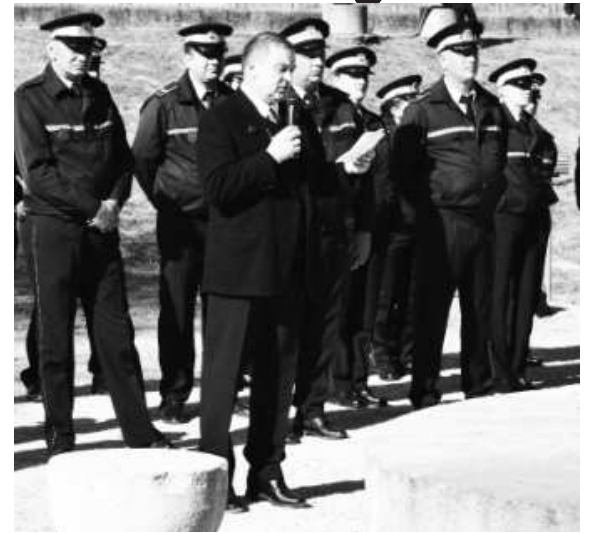
Monumental „Calea Eroilor” la patrimoniul UNESCO.