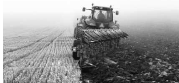
Astăzi agricultura este mai ales agrotehnică, știință, practică superioară.

Practic agricultura de azi nu mai are nimic, dar absolute nimic, în comun cu plugăritul de pe vremuri.