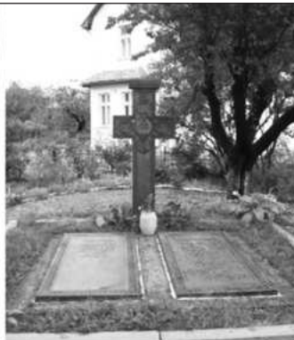
Mormintele celor doi, din curtea casei