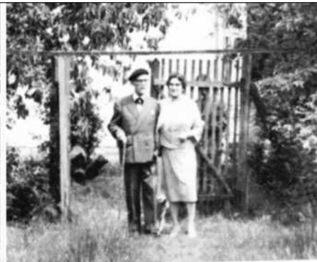
Tudor Arghezi și soția sa, Paraschiva Arghezi

titlul: "Un impostor: Tudor Arghezi". Al. I. Ștefănescu a publicat în "Contemporanul" o "Scrisoare deschisă d-lui Tudor Arghezi", în care detesta, culmea!, vocația de pamfletar a marelui poet. Miron Radu Paraschivescu revine cu un foileton virulent, "Drumurile unui poet: Tudor Arghezi", publicat în mai multe numere din "Scân-teia", începând cu 13 martie 1947.