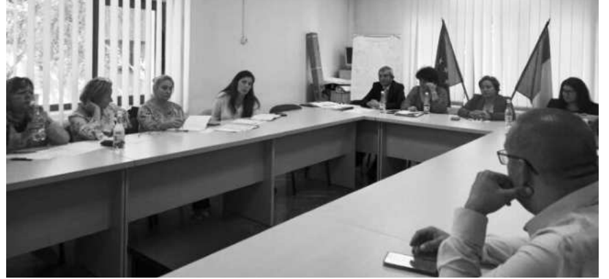
sociali din cadrul Direcției Generale de Asistență Socială și Protecția Copilului Gorj, asistenți sociali și persoa-

Au fost abordate aspecte privind situația socială la nivel județean din perspectiva specialiștilor și a serviciilor sociale existente și necesare ca urmare a nevoilor identificate, impactul noilor prevederi legale în domeniu, necesitatea recrutării de specialiști - asistenți sociali, atragerea de finanțări pentru dezvoltarea de servicii sociale integrate și asigurarea sustenabilității acestora. S-au detaliat realizările proiectului până în prezent, evidențiind impactul pozitiv asupra comunității locale în mod special a celor din mediul rural și beneficiile aduse. La eveniment au fost prezenți reprezentanți ai Consiliului Județean Gorj, specialiști și asistenți