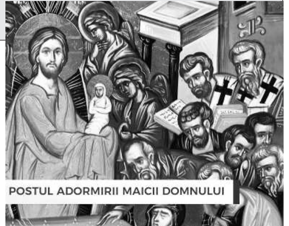
POSTUL ADORMIRII MAICII DOMNULUI