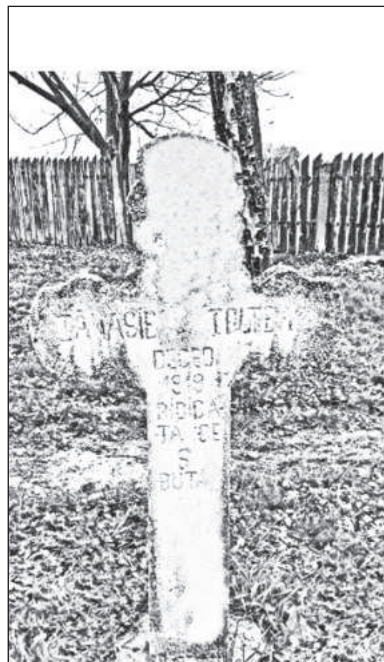
Mormântul lui Tănase Toltea, d.1919.

9. Paul Rezeanu., Craiova-orașul celor o mie de milionari-(Istoria Craiovei între 1800-2000). Editura Info, Craiova 2017, p.181.