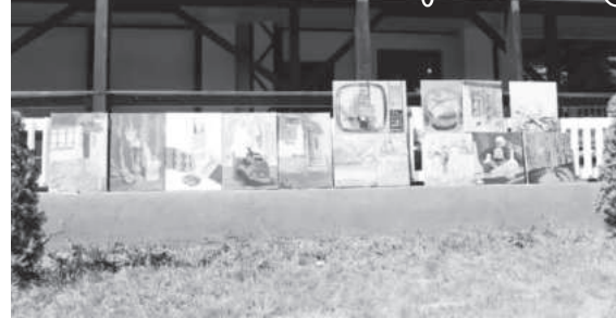
Tabăra de creație IOSIF KEBER - ARTE-LIT

La începutul lunii august din acest an, lună cunoscută până nu de mult în popor sub denumirea de Gustar, o nouă manifestare culturală destinată tinerilor aspiranți în devenire artistică și literară a luat sfârșit: este vorba despre Tabăra de creație IOSIF KEBER - ARTE-LIT, coordonator Viorel Surdoiu. Locul de desfășurare a acestei manifestări culturale a fost localitatea Baia de Fier, localitate care, timp de o lună de zile, a găzduit