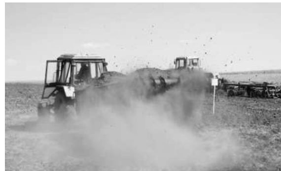
Numai bine compostat și administrat corect gunoiul de grajd este cu adevărat o comoară.

În general, la o administrare de 40 to gunoi de grajd mixt/ha, în primul an acesta cedează solului jumătate din substanțele nutritive conținute, în al doilea an cedează jumătate din ce a rămas, adică un sfert din total, iar în anii 3 și 4 câte o optime din toată compoziția sa.