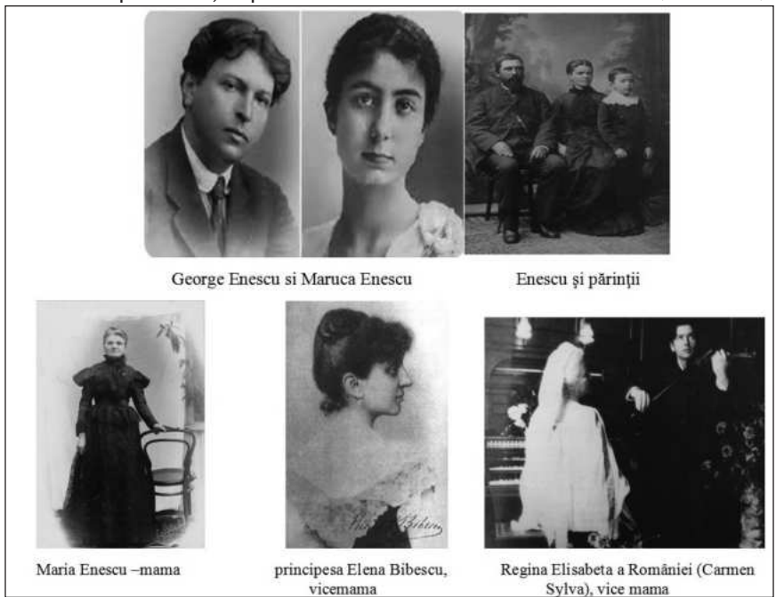
George Enescu și Maruca Enescu

Un alt moment festiv ce ține de glorie a fost alegerea ca membru titular al Academiei Române, (27 martie 1932), la propunerea matematicianului Gheorghe Țițeica. De menționat, că Enescu era deja membru onorific din anul 1916, în sesiunea condusă de Barbu Ștefănescu-Delavrancea. Trebuie să amintim că George Enescu a suferit foarte mult când a aflat că George Coșbuc, strălucitul poet pe care l-a dat Ardealul, creatorul unui sistem prozodic unic, principalul izvor de plăcere artistică, și Barbu Ștefănescu-Delavrancea, strălucitul orator al României contemporane, au trecut la odihna cea mare, în lumea de dincolo, la date apropiate, primul, la 09.05.1918, iar secundul, la