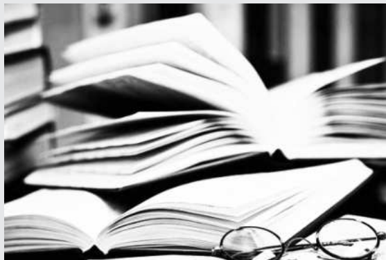
„Limba română e patria mea”