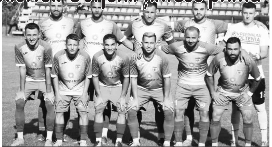
Gilortul - Universitatea Craiova 2 2-1 (1-1)